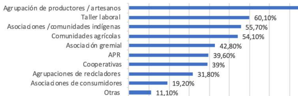
Figura 6. ¿Cuáles de las siguientes organizaciones presentadas promueve o apoya el municipio? (se puede marcar más de una opción)

Respecto de los tipos organizacionales promovidos y/o apoyados por las municipalidades y tal como se consigna en Figura n°6, se propuso un listado de estas y también la posibilidad de agregar “otras”. Ello, indicando expresamente que era posible marcar más de una opción. Así entonces, los principales tipos organizacionales en los que las municipalidades concentran el trabajo son en primer término las agrupaciones de productores / artesanos (89%), los talleres laborales (60,1%), y asociaciones / comunidades indígenas (55,7%). Por su parte las cooperativas aparecen con 39% de las menciones y en la categoría “otras” (11,1%), se mencionan agrupaciones culturales, organizaciones de mujeres, sindicato de pescadores, organizaciones de migrantes, grupos animalistas, fundaciones, organizaciones de adultos mayores, entre otras.